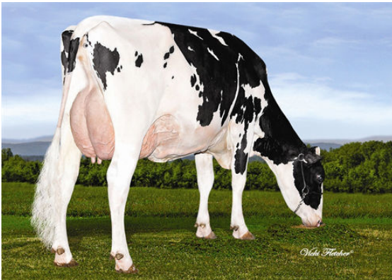
VALLEYCLAN JETER PATSY